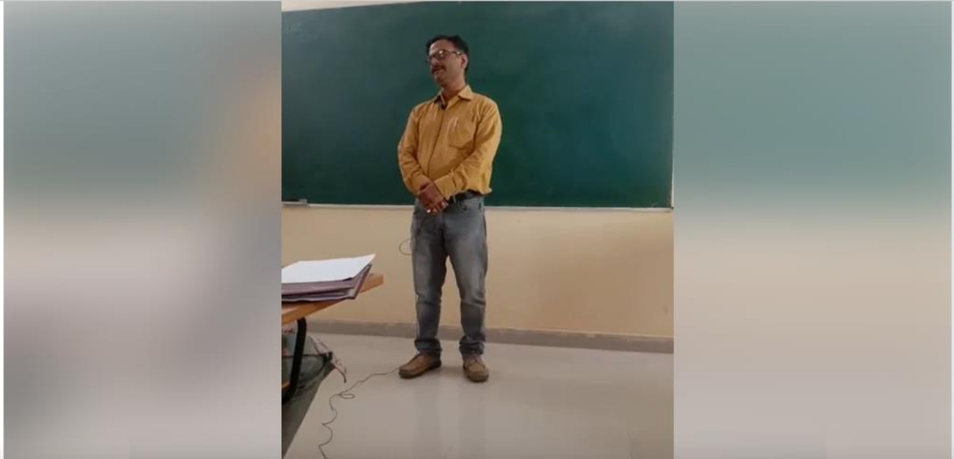
CLASSES AT CAMPUS SCHOOL, CSJMU FOR MUKHYAMANTRI ABHYUDAYA YOJANA FOR IAS/PCS COACHING